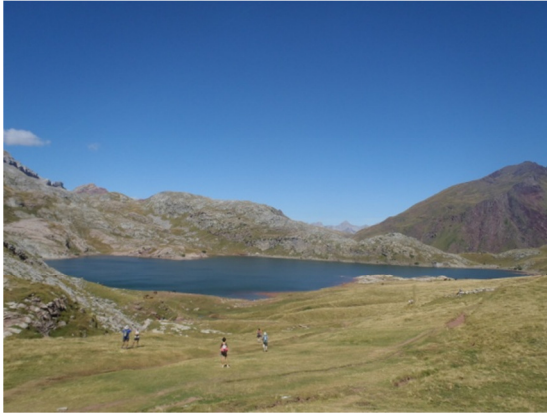
Vista del Ibón de Estanés