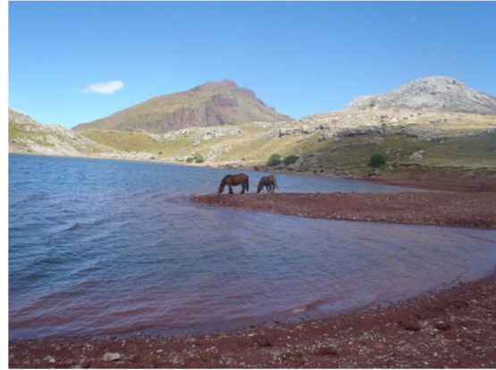
Caballos en el litoral del ibón