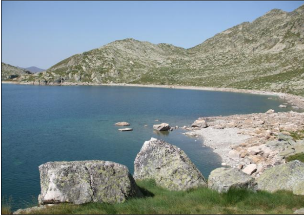
Vista de la zona litoral del lago