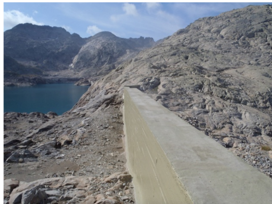
Detalle de la presa.