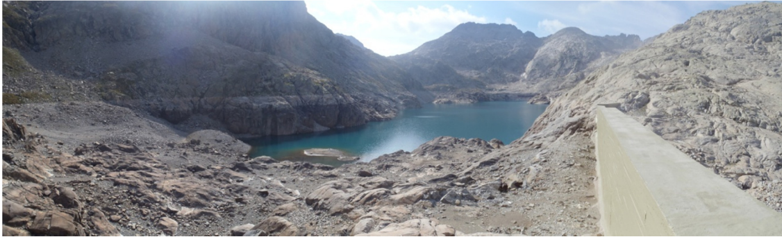
Vista panorámica del lago y de la presa, puede apreciarse el bajo nivel de agua en la fecha de muestreo