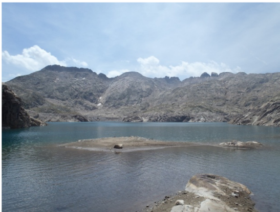
Detalle del lago.