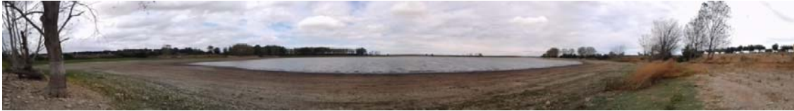
Panorámica de la laguna.