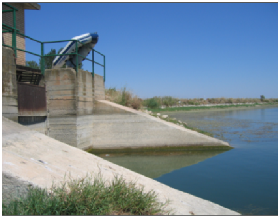
Imagen de la presa (foto de 2009)