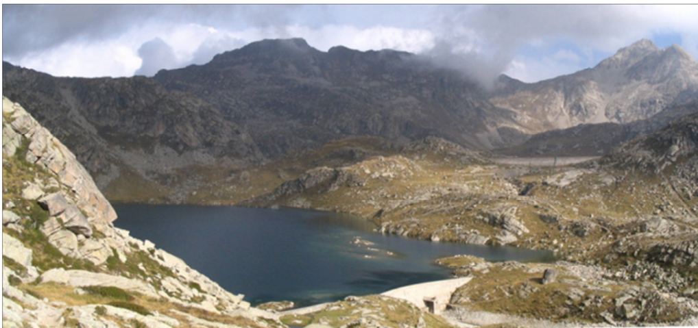
Fotografía de 2010.