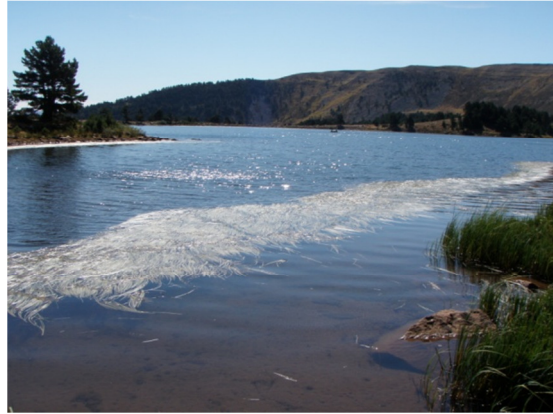
Hidrófitos: Sparganium angustifolium