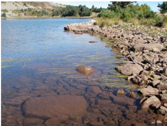
Imagen del litoral con hidrófitos