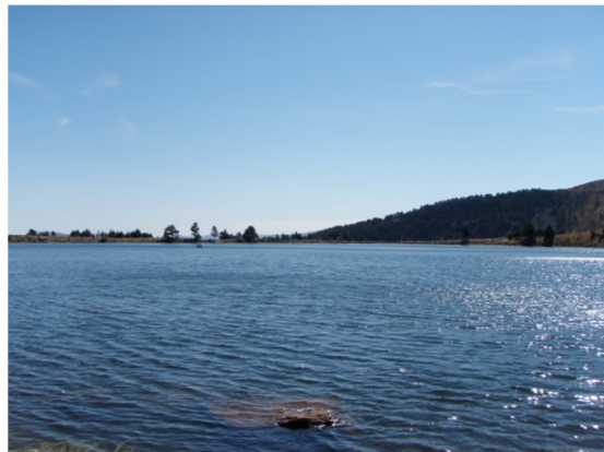
Vista desde la orilla