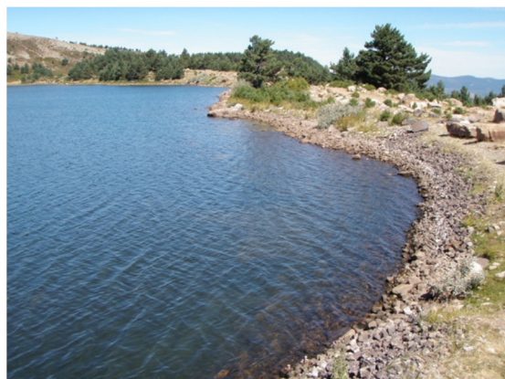
Vista del litoral.